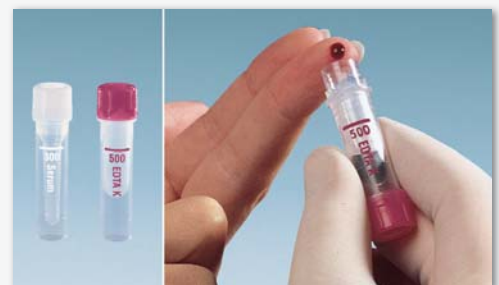
Microvette® 300/500 – Extracción de sangre con el borde de recogida

Si desea más información, contacte con nosotros.