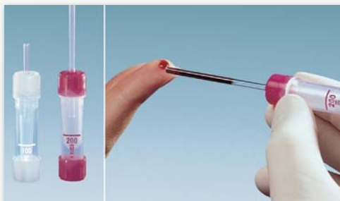
Microvette® 100/200 – Extracción de sangre con capilar end-to-end